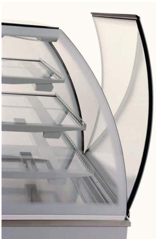
Oblé výklopné přední izolační dvojsklo